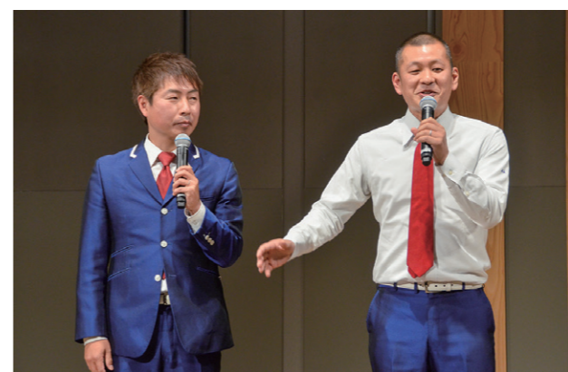
U字工事様 大交流会散歩