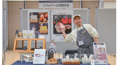
34 イヴォワール洋菓子店