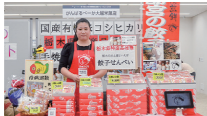
26 がんばるべーが大越米菓店