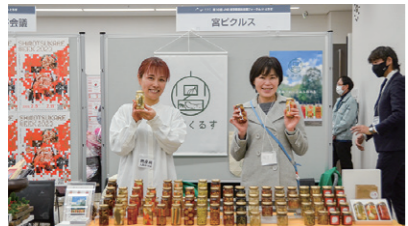
25 株式会社 Cooking&Glow