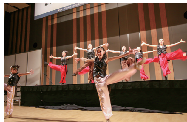
オープニング Dance S Company パフォーマンス