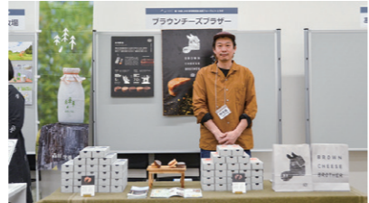
30 株式会社 GOODNEWS