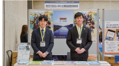
29 独立行政法人 中小企業基盤整備機構