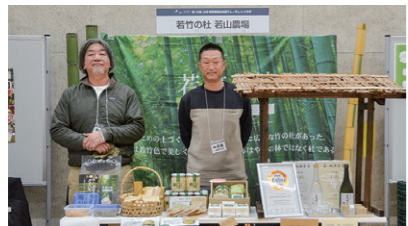
19 若竹の杜 若山農場