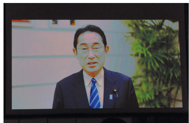
内閣総理大臣 岸田文雄様 ご祝辞VTR