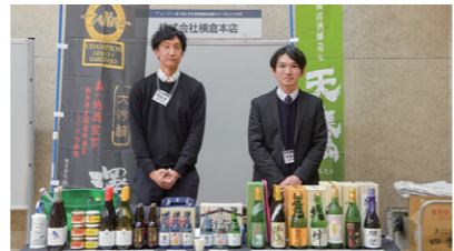
27 株式会社横倉本店