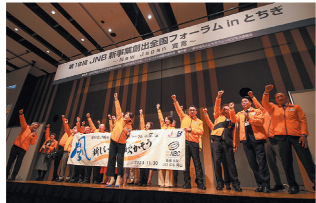
次年度全国フォーラムPR：中国地域NBC様