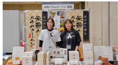
21 ビューティアトリエグループ パウムハウス樹凛