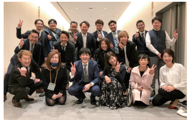
全国フォーラム実行委員会メンバー