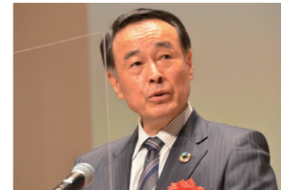
独立行政法人中小企業基盤整備機構 理事長 豊永 厚志