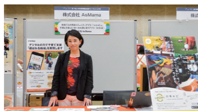
23 株式会社 AsMama