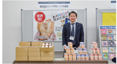
31 株式会社パン・アキモト