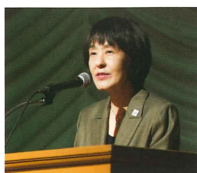
北海道 知事 高橋 はるみ 様