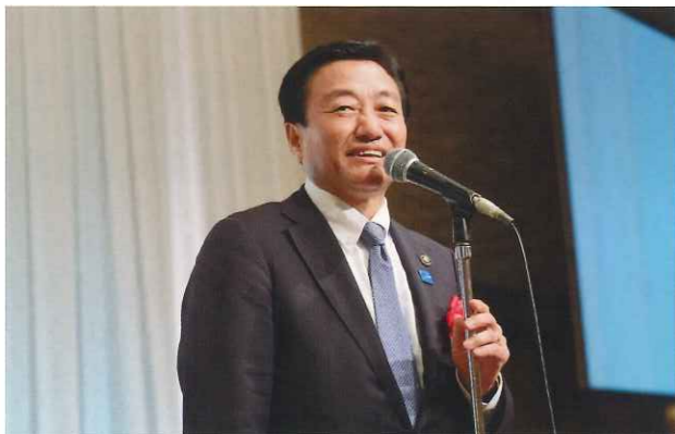
来賓挨拶② 高松市長 大西 秀人 様