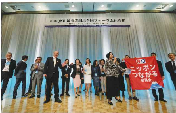
東京NBCニッポンつながる委員会PR