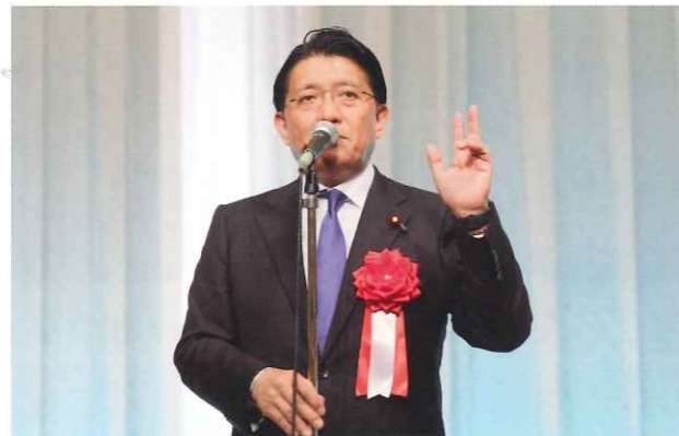
来賓挨拶① 衆議院議員 平井 卓也 様