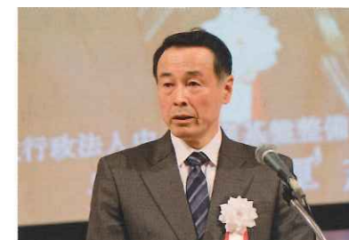
独立行政法人 中小企業基盤整備機構 理事長 豊永 厚志