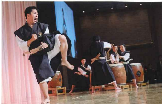
オープニング 「多度津京極少林寺拳法太鼓」太鼓演奏と少林寺拳法の演武 披露