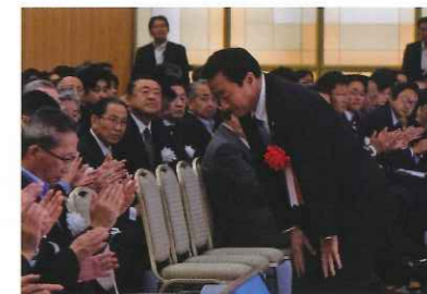
高松市長 大西 秀人 様