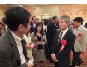
懇親会会場の様子