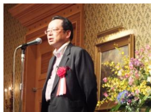
合同懇親会; 来賓挨拶 経済産業省小宮審議官